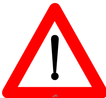
Figuur 2: Verkeersbord A51.

De Minister van Verkeerswezen bepaalt de minimum afmetingen van deze signalisatie.