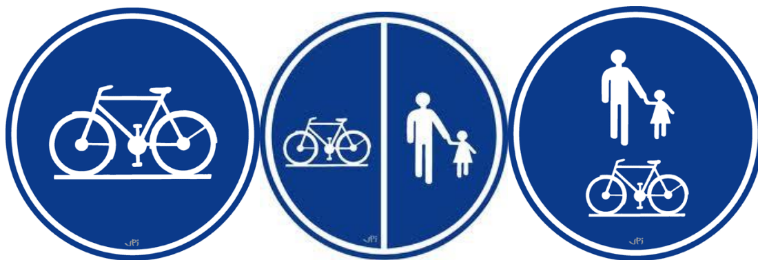
Figuur 3: Verkeersborden D7 (links), D9 (midden) en D10 (rechts).

De drie- en vierwielers zonder motor waarvan de breedte, lading inbegrepen, minder is dan 1 meter, mogen eveneens het fietspad volgen.